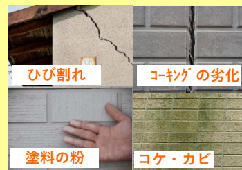
ひび割れ コーキングの劣化 塗料の粉 コケ・カビ

屋根・樋・外壁工事は、足場が必要となることが多い為 同時期の施工が経費削減にもなりお得です。